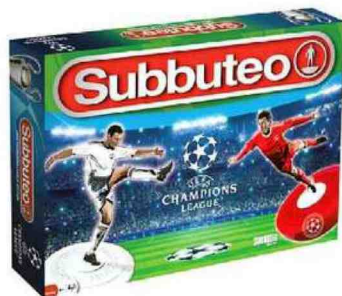
★ Il nuovo Subbuteo è dedicato alla Uefa Champions League (Rocco Giocattoli)